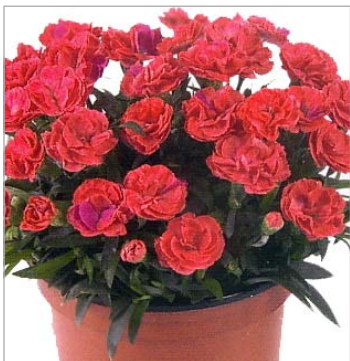
Roselly Salmon (lachsrosa)