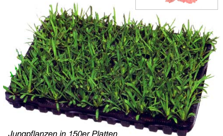
Jungpflanzen in 150er Platten