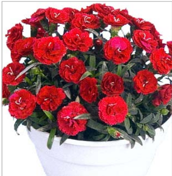
Roselly Red - Hauptsorte