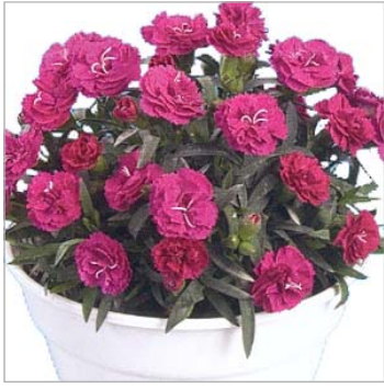
Roselly Lila - Hauptsorte