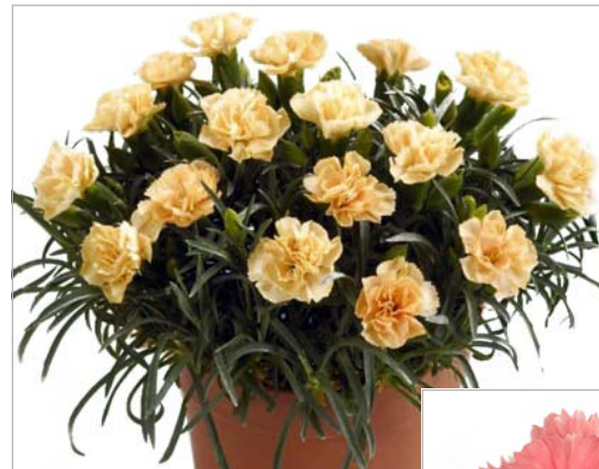
Colori Roni (gelb)